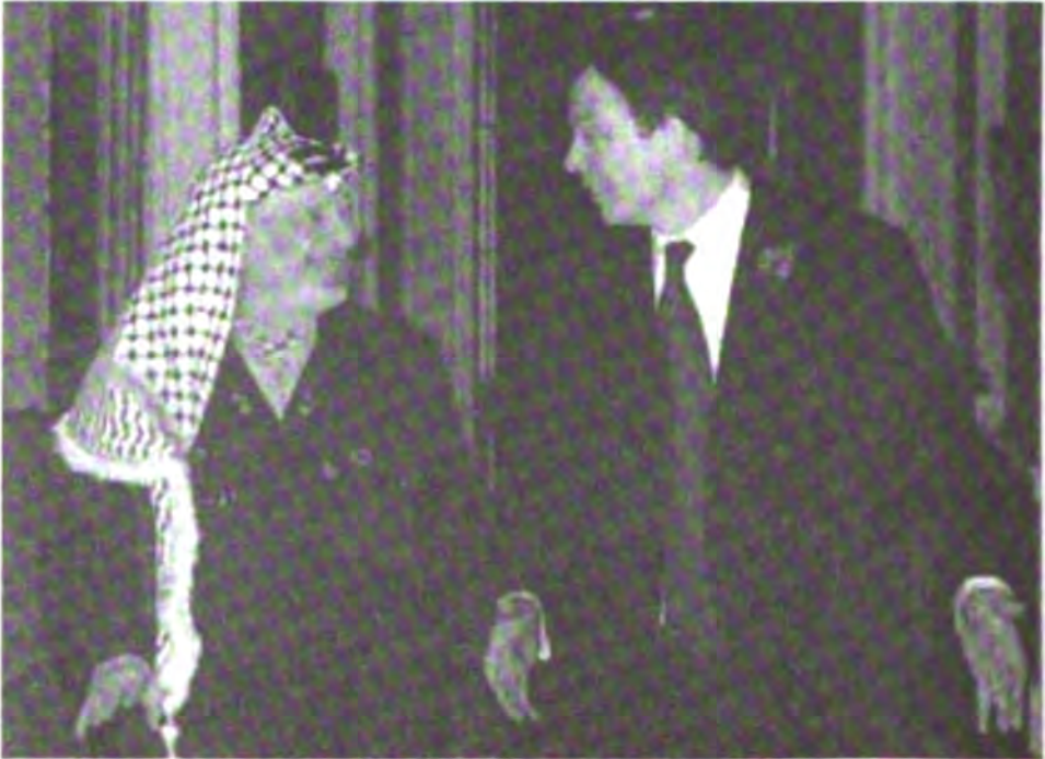
مع رئيس وزراء بريطانيا طوني بلير